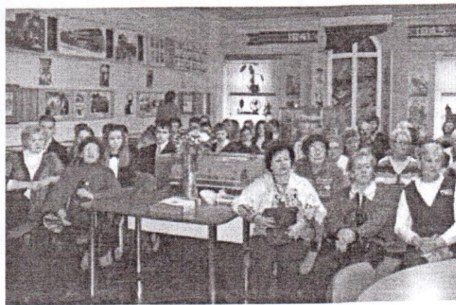
Встреча с блокадниками в музее АО «Пролетарский завод»