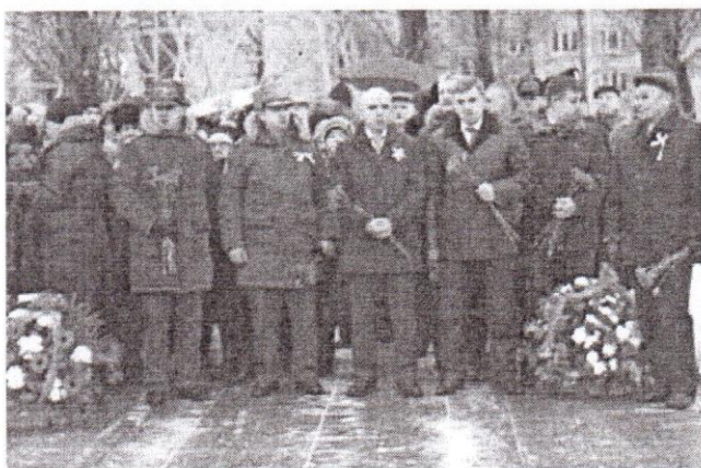
Возложение венков на кладбище «Журавли»

Напомним, что все дни блокады «Пролетарский завод» работал и, несмотря на обстрелы, бомбежки и значительное сокращение численности работающих, не снижал темпов производства. Стойкостью и мужеством ленинградцев, сумевших выстоять в самой жестокой осаде в мировой истории, невозможно не восхищаться! Мы поздравляем блокадников-заводчан! Мы помним о тех, кого уже нет – вечная им память и вечная наша благодарность!