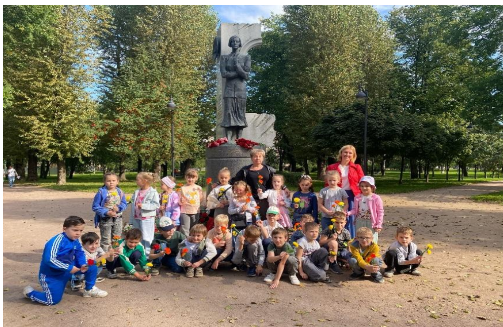
1-б класс у памятника Ольги Федоровны Берггольц