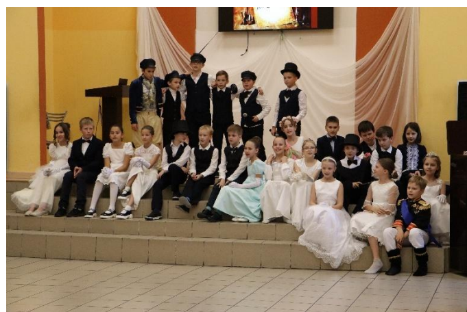
Фрагменты театральных зарисовок 4-6 класс