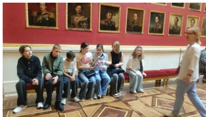
Размышляем о подвигах русских генералов в галерее Отечественной войны 1812 года