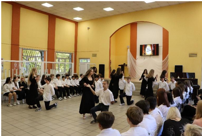
Полонез в исполнении учащихся 9-10 классов

В завершении дня прошел концерт, подготовленный учениками лицея. Были вокальные, танцевальные номера и сценки. Концерт был трогательным и интересным. Этот день был очень насыщенный и запомнится надолго.