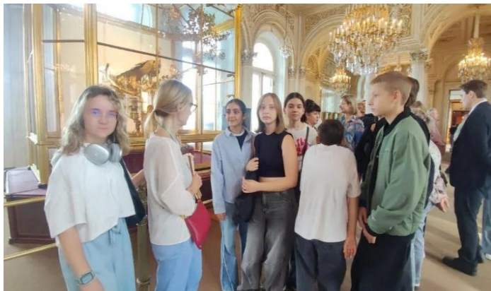
Восхищаемся часами "с заводными фигурами"

Любуемся роскошью каждой детали интерьера Павильонного зала