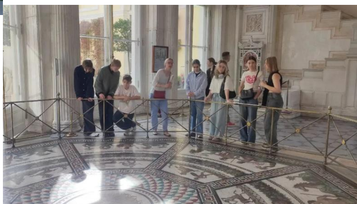
Изучаем древнеримскую мозаику