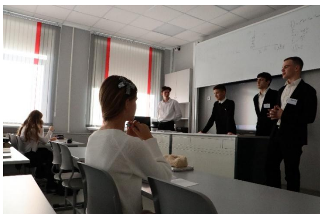
В новом кабинете физики

На первом уроке я провел совещание для своих заместителей, где мы обсудили план обучения на день. Позже я смотрел, как учителя проводят уроки и поздравлял коллег и обучающихся с праздником.»