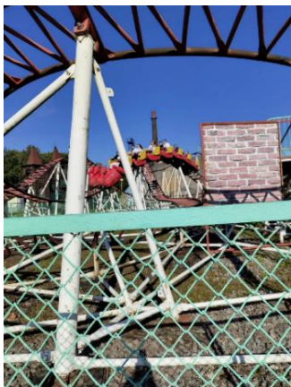
А это наша карусель!

Когда карусель плавно поехала, а потом закружилась, обычный осенний день превратился в настоящее приключение. Мы сигналили, смеялись и махали друг другу, словно участвовали в большом городском параде. Кружились не только мы, но и летящие с деревьев золотые листья.