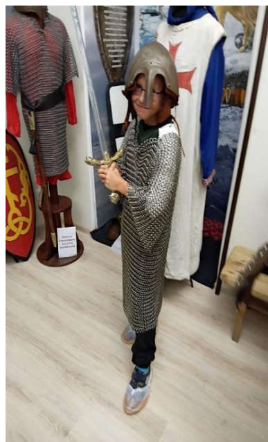
Примерка кольчуги и шлема эпохи Александра Невского.