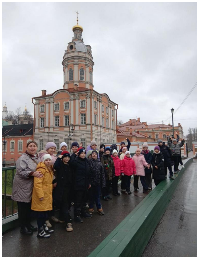
Класс на фоне Свято-Троицкой Александро-Невской лавры в Санкт-Петербурге

Какими же качествами должен был обладать юный князь, чтобы стать символом несломленного духа России? Александр с детства учился владеть собой в любой ситуации, ставить интересы своего народа выше собственных и быть его надежной опорой и защитником. Именно эти принципы –