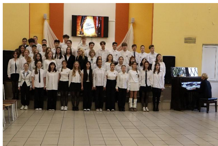
Исполнение Гимна лицея учениками 8-х классов

«Я провела урок математики у седьмого класса. Для этого подготовила презентацию и несколько увлекательных заданий по теме «Числовые отрезки и интервалы». Я постаралась провести урок так, чтобы детям было понятно и интересно. Мне понравилось быть учителем, поскольку ребята