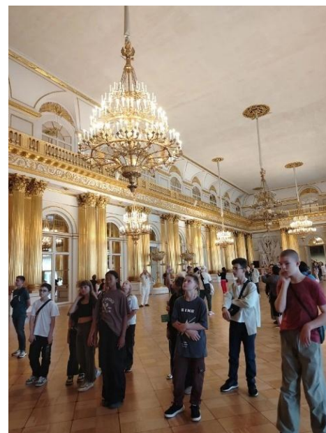
В Гербовом зале рассматриваем величественную колоннаду

Это стало для нас удивительным путешествием во времени. Мы получили море впечатлений и новых знаний и обязательно вернемся сюда не раз!